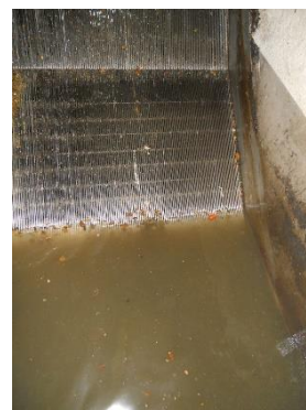
Foto: Abwasser im Zulauf der Kläranlage

Dadurch erfüllt der Wasserverband Neufelderseen-Gebiet einerseits den gesetzlichen Auftrag der Gemeinden, andererseits gewährleistet er durch die Abwasserreinigung die hohen Wassergütwerte der zahlreichen Seen, Gewässer und vor allem des Grundwassers in unseren Gemeinden.