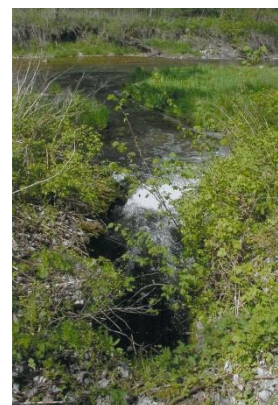
Foto: Gereinigtes Abwasser im Ablauf zur Leitha

→ ZUM SCHUTZ DER GEWÄSSER, DER UMWELT, DER GESUNDHEIT UND FÜR EINE LEBENSWERTE ZUKUNFT!