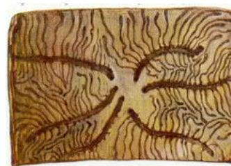
Fraßbild des Kupferstechers